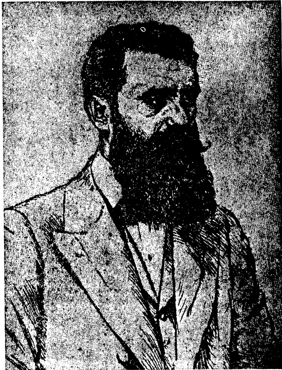
ד"ר טעאָדאָר (בנימין זאב) הערצל